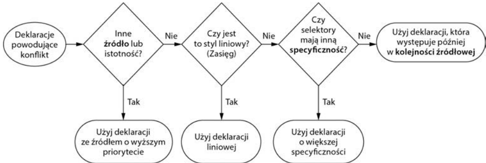
Rysunek 1.3. Ogólny diagram kaskady prezentujący pierwszeństwo deklaracji